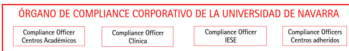
Fig 2. Composición del Órgano de Compliance Corporativo

Este órgano estará formado por el Compliance Officer (que se define en los apartados siguientes) de uno de los centros, y al menos otros dos de los Delegados de Compliance o Compliance Officers del resto de centros.