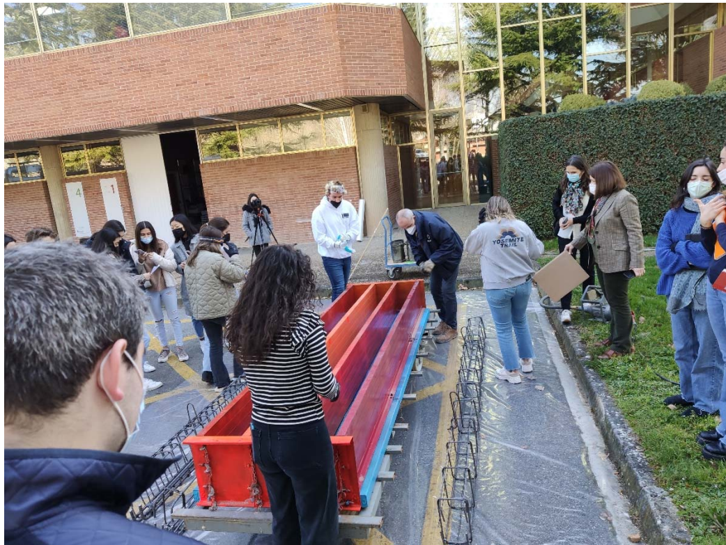
Figura 1 – Colocación de la armadura en los moldes