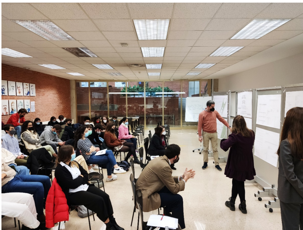
Figura 1: Crítica del DPI, diciembre de 2021.

El objetivo principal era una integración total de los contenidos de las materias de tercero de arquitectura del primer semestre con la asignatura de proyectos. Se consiguió completamente, prueba de ello es el jury (crítica) conjunto de todas las materias junto con la asignatura de proyectos (ver Figura 1).